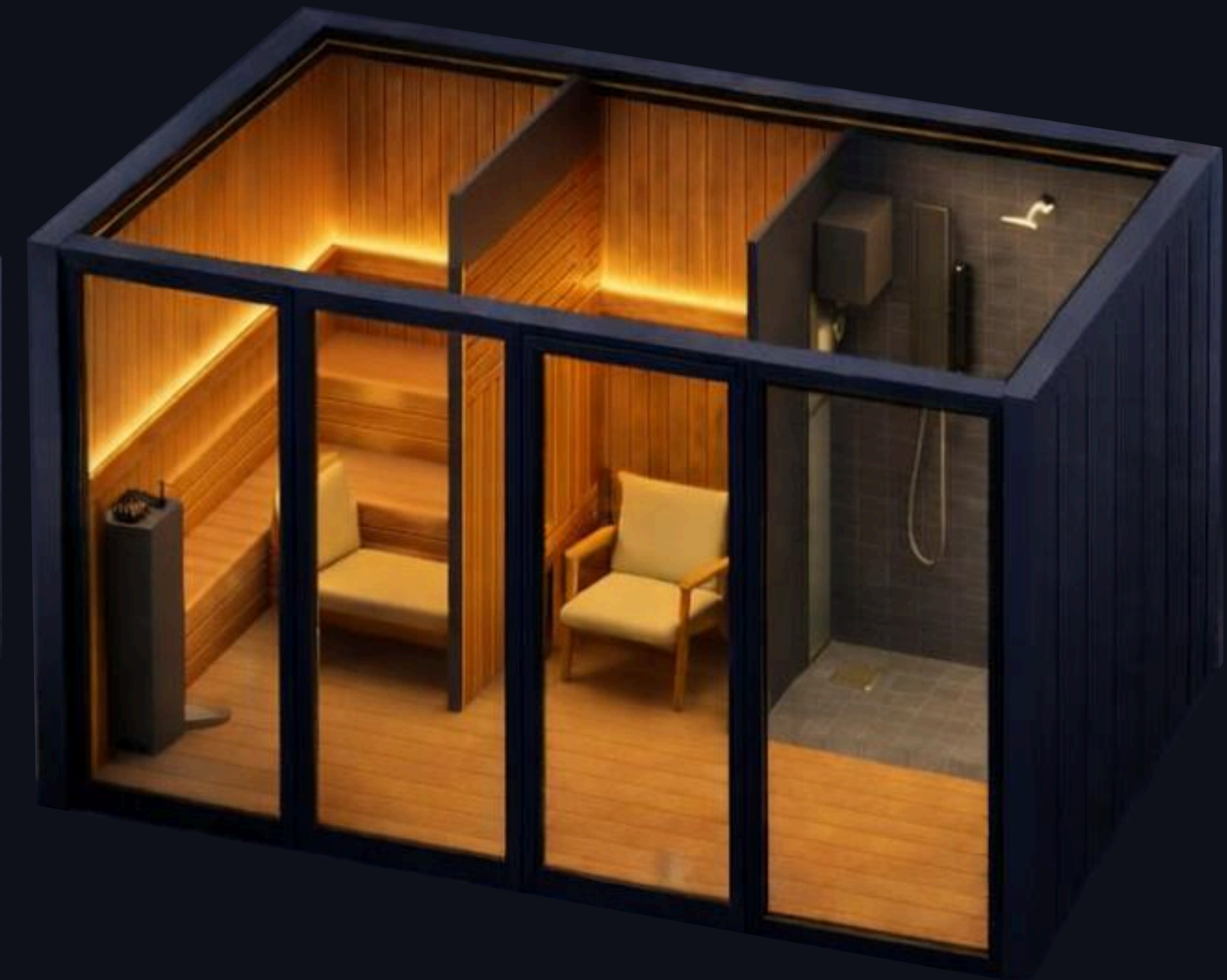
Sauna + Sala de relajación + Ducha