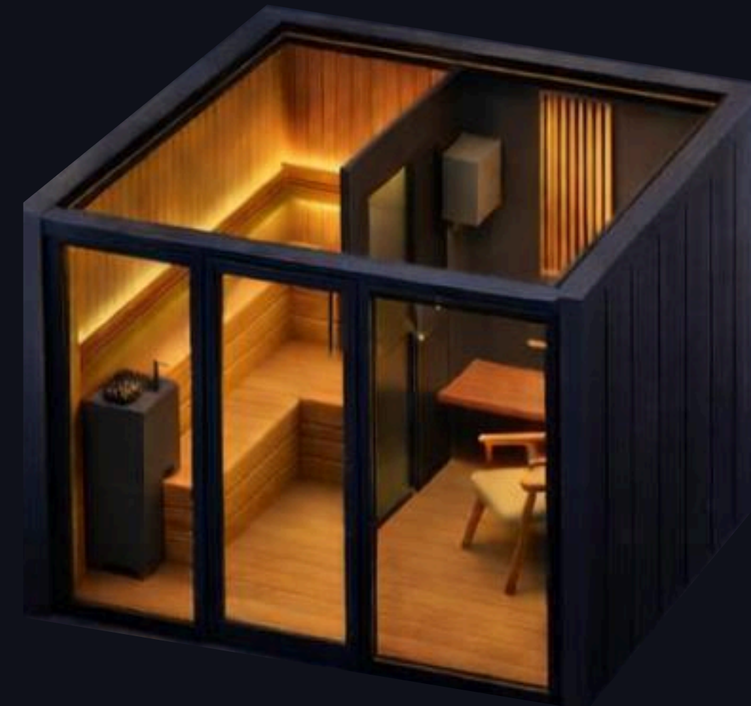
Sauna + Sala de relajación